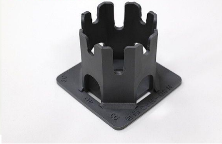
メッシュ用サイコロ H30-40